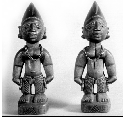
Ibêjis, em sua apresentação original africana, eram orixás gêmeos, sincretizados assim com Cosme e Damião.

No dia 27 de setembro será realizada a sessão comemorativa de Ibêjis em nossa casa a partir das 19h. Participe conosco e convide também seus amigos! Às 15h teremos também distribuição de doces de Cosme e Damião.