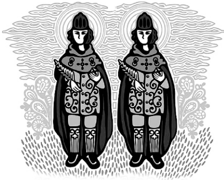
Cosme e Damião se tornaram santos católicos pelo exemplo que deixaram no auxílio aos mais necessitados.

A origem do sincretismo entre os santos católicos e o orixá africano na Umbanda.